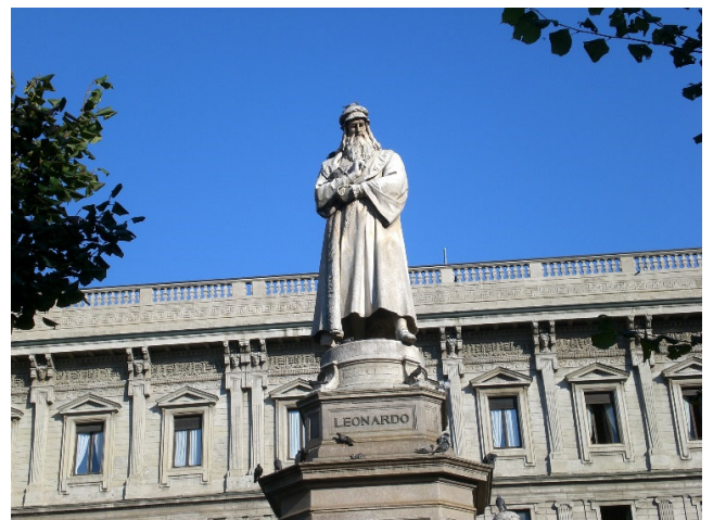
Leonardo da Vinci Mailand

Um das Wirken von Leonardo da Vinci verstehen zu können, werden Sie heute in das kulturelle Umfeld eintauchen, in dem er lebte. Ein geeigneter Ort ist die Pinacoteca Ambrosiana , eine wahre Schatztruhe, die sein „Portrait eines Musikers“ und seinen „ Codex Atlanticus “ aus dem Jahre 1353 beherbergt. Der Kodex ist eine beeindruckende Sammlung von Studien und Zeichnungen, die den Maßstab für Leonardos Genie verdeutlicht. Er war neugierig auf alles; kein Aspekt der Wirklichkeit war ihm gleichgültig. Die Sammlung befindet sich in der angeschlossenen Ambrosianischen Bibliothek , eine der ersten öffentlichen Bibliotheken in Europa. Sie besitzt heute 700 000 Bücher, darunter eine illustrierte „Ilias“ aus dem 5. Jh. und eine Ausgabe der „Göttlichen Komödie“ von Dante.